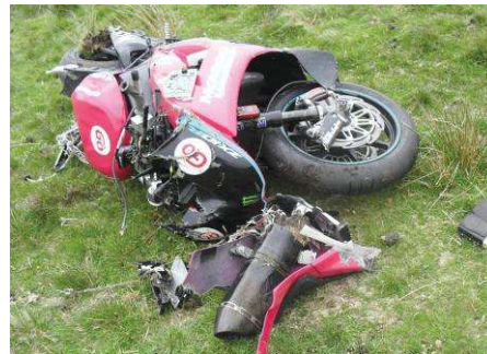
Compression, Cummins 2010