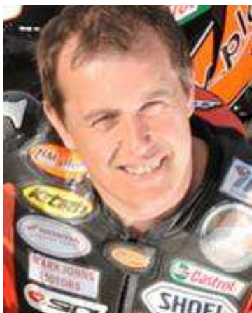
John Mac Guinness, le héros

John Mac Guinness , 17 victoires au TT, 29 podiums. Cet anglais de 39 ans est le pilote encore en activité comptant le plus de victoires sur l'île de Man.