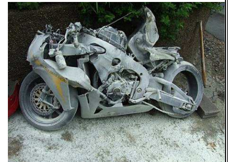
Retour de flamme, Martin 2010

Pour mieux situer le bonhomme, voici sa déclaration quelques semaines avant son énorme crash de 2010 : « Vous m'emmènerez pas entre 4 planches tant que j'aurais pas gagné un TT sur 6 tours ». Ok.