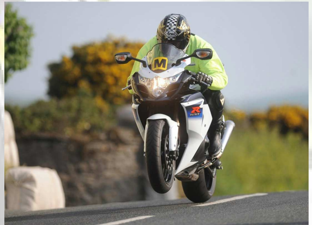
Marshall en action...

Il est formellement interdit de traverser la route pendant les courses ( si certains se posaient la question... ), mais c'est possible pendant les pauses entre chacune, après le passage des Marshall en moto, qui ouvrent et ferment la route. Ce sont des anciens pilotes, habillés en fluo avec un gros « M » collé sur la moto.