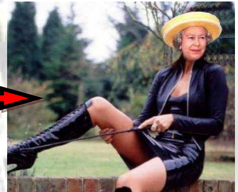
La Reine Elisabeth II, Babette pour les potes

En gros l'île de Man est à l'Europe ce que l'ornithorynque est au règne animal : un espèce de truc construit avec des bouts de n'importe quoi qui trainait dans un coin, d'une utilité toute relative, mais justement fascinante de par sa différence.